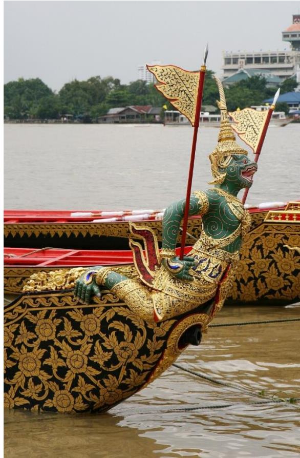
โขนเรือพาลีรังทวิป

สมเด็จพระรามาเมศวร จึงมีการนำรูปตัวละครทหารเอกฝ่ายพระรามมาสร้างเป็นโขนเรือพระราชพิธีร่วมอยู่ในขบวนพยุหยาตราทางชลมารค