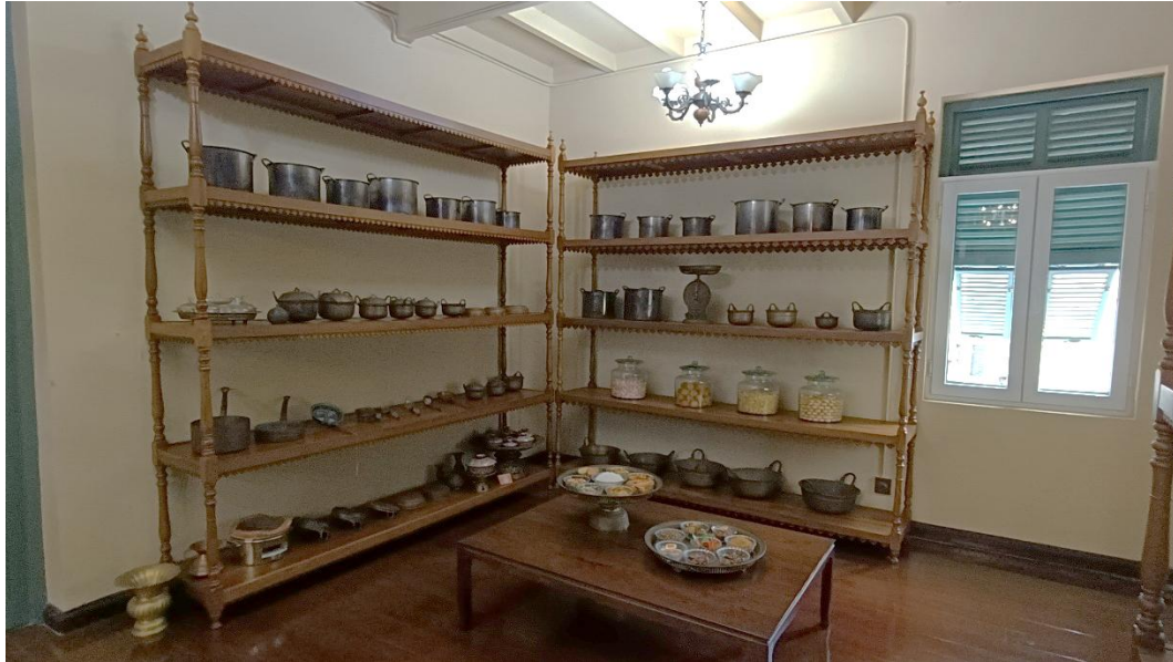
นิทรรศการที่จัดแสดงภายในห้องครัวของพระตำหนัก

นอกจากสระอันกว้างใหญ่แล้ว ในเขตด้านหน้าตำหนักยังมีเนินดินใหญ่มีต้นไม้หลายพันธุ์ปลูกอยู่บนเนินดิน ทำให้เนินนี้ดูสูงเด่นคล้ายภูเขาสวยงาม เนินดินแห่งนี้มีมาแต่ครั้งสร้างสวนสุนันทาโดยนำเอาดินจากการขุดคลองเม่งเส็งข้างพระที่นั่งอัมพรสถานมาก่อเป็นเนินดิน ข้างใต้เนินดินสร้างเป็นอุโมงค์คอนกรีต เมื่อพระวิมาดาเธอฯ เสด็จมาประทับได้ทรงกำหนดให้ใช้อุโมงค์นี้เป็นที่เก็บเครื่องกระเบื้องถ้วยชามซึ่งทรงมีอยู่มากมาตั้งแต่ครั้งทรงกำกับห้องเครื่องในสมัยรัชกาลที่ ๕ ๔