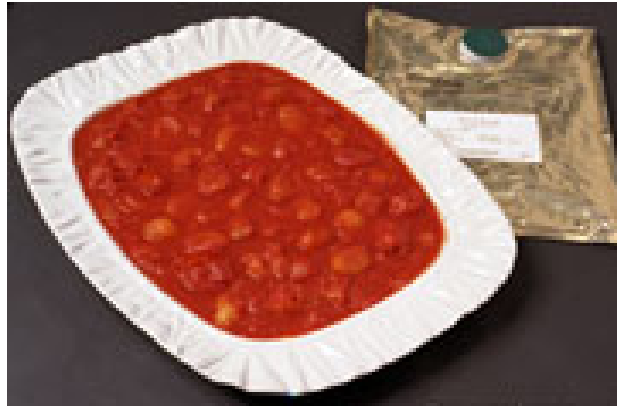
ภาพ 4.1 อาหารพร้อมปรุงสำเร็จที่ผลิตมาจากมะเขือเทศสีดา

ตัวอย่างการพิมพ์ภาพประกอบ (กรณี que ถ่ายภาพด้วยตนเอง ไม่นำภาพผู้อื่นมาอ้างอิง)