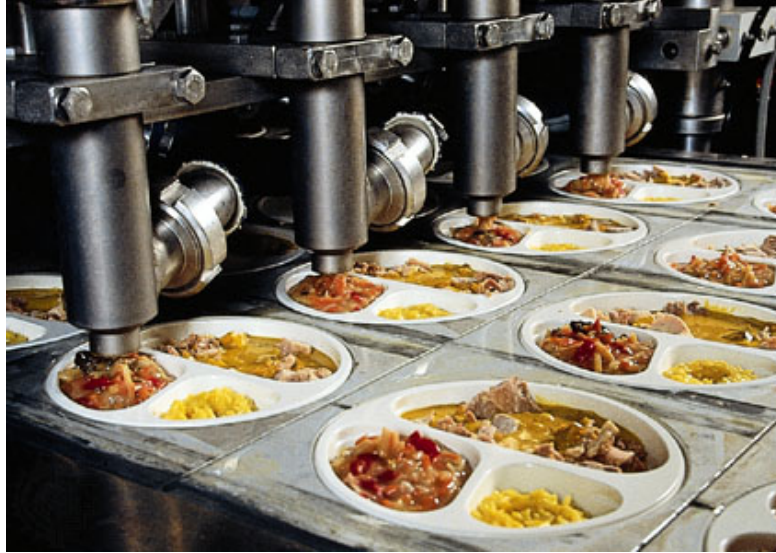
ภาพ 4.1 การบรรจุอาหารแบบอัตโนมัติด้วยเครื่องจักรกล

ตัวอย่างการพิมพ์ภาพประกอบ (กรณีที่น่าภาพผู้อื่นมาอ้างอิง)