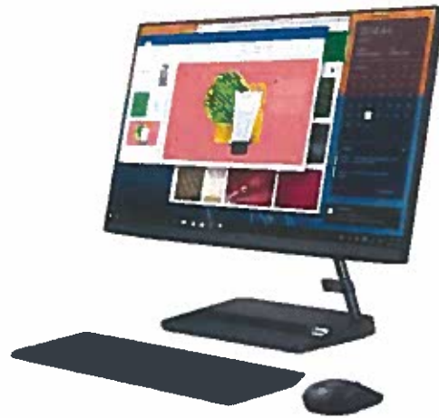
Keyboard and mouse not included

Even with a sleek, compact frame, the IdeaCentre AIO 3i packs a real punch. Experience seamless high performance and pin sharp visuals with up to Intel® Core™ processing and NVIDIA® GeForce® graphics. Enjoy faster boot times with a solid state drive (optional) and, with up to 1TB storage, there's enough space for all your family's music, photos, and videos.