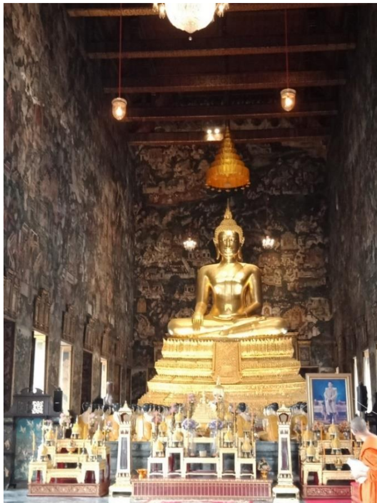
ภาพจิตรกรรมฝาผนังในพระอุโบสถ วัดสุทัศนเทพวราราม เป็นจิตรกรรมสมัยรัตนโกสินทร์ตอนต้น

วัดสุทัศนเทพวราราม เป็นพระอารามหลวงชั้นเอกพิเศษ ชนิดราชวรมหาวิหาร ถูกสร้างขึ้นตามพระราชดำริของพระบาทสมเด็จพระพุทธยอดฟ้าจุฬาโลก หรือตอนต้นของกรุงรัตนโกสินทร์ ทำให้วัดแห่งนี้ได้รับอิทธิพลของศิลปกรรมบางส่วนจากสมัยอยุธยาตอนปลาย มีปรากฏอยู่ในงานสถาปัตยกรรม งานประติมากรรม รวมถึงงานจิตรกรรมของวัดถูกสร้างขึ้นในสมัยรัชกาลที่ ๓ ด้วยฝีมือช่างหลวง และมีการซ่อมแซมเพิ่มเติมในช่วงรัชกาลที่ ๔-๕