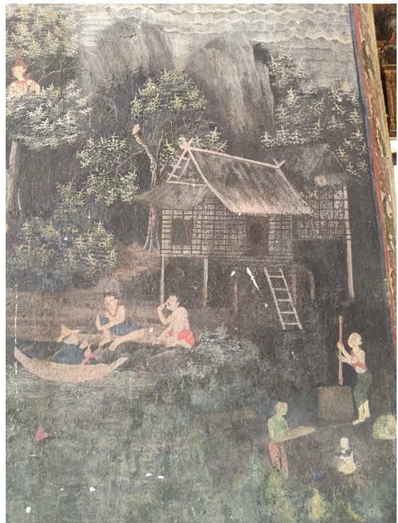
ภาพแสดงเหตุการณ์ในชีวิตประจำวัน (การดำข้าว การฟัดข้าว การพูดคุยกันระหว่างคนไทยกับคนจีน) ของชาวบ้าน ที่มีลักษณะของสรีระแบบเสมือนจริง มีเรือนเครื่องผูกสำหรับอยู่อาศัยภายในพระวิหารหลวง วัดสุทัศนเทพวราราม