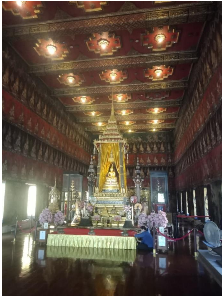
ภาพจิตรกรรมเทพชุมนุมบนฝาผนังพระที่นั่งพุทไธสวรรย์ พิพิธภัณฑสถานแห่งชาติพระนคร สร้างขึ้นราว รัชกาลที่ ๑-๒ หรือช่วงรัตนโกสินทร์ตอนต้น