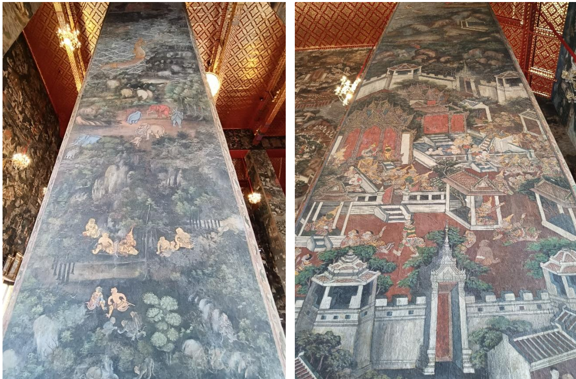
ภาพแสดงเทคนิคการแบ่งภาพด้วยภาพธรรมชาติ (ต้นไม้ แนวเส้นน้ำ) และสิ่งปลูกสร้าง (กำแพงเมือง) ภายในพระวิหารหลวง วัดสุทัศนเทพวราราม

สาเหตุที่มีการเขียนเรื่องราวต่างๆมากขึ้นในช่วงเวลานี้ อาจเนื่องจากเหตุผลที่พระบาทสมเด็จพระนั่งเกล้าเจ้าอยู่หัว ทรงมีพระราชปณิธานในการสถาปนาวัดวชิราราม ที่โปรดเกล้าฯ ให้มีการรวบรวมศิลปวิทยาการต่างๆไว้ที่วัด ต้องการให้วัดเป็นแหล่งศึกษาหาความรู้ และอีกประการที่สำคัญ คือ การเรียนรู้เรื่องต่างๆ ที่ละเอียดขึ้นตามคัมภีร์ทางศาสนา สอดคล้องกับการสร้างงานศิลปกรรมหลายอย่างที่มาจากพระคัมภีร์ อันแสดงถึงพระราชปณิธานในการอนุรักษ์