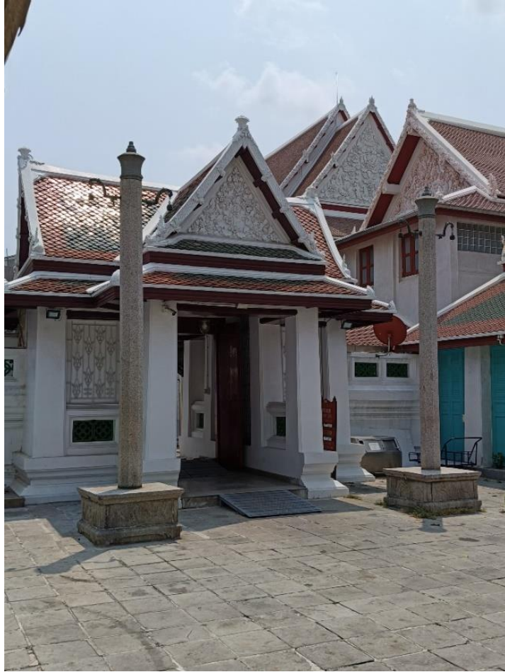
ภาพของซุ้มประตูทางเข้าเขตสังฆาวาส และอาคารรูปแบบพระราชนิยม ประดับลวดลายอย่างเทศของวัดสุทัศนเทพวราราม

ในส่วนของงานจิตรกรรมแบบพระราชนิยมในสมัยรัชกาลที่ ๓ มีการเปลี่ยนแปลงโดยสรุป ดังนี้ ๗