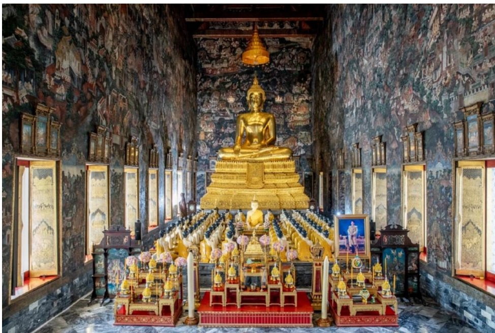
ลักษณะภายในพระอุโบสถพระอุโบสถวัดสุทัศนเทพวราราม พระพระพุทธรูปโลกเชษฐูประประธาน และพระอสีติมหาสาวก ๘๐ องค์

พระอุโบสถมีเสาศาครทั้งหมด ๖๘ ต้น ตัวอาคารพระอุโบสถเว้นระยะจากแนวเสาของฐานไฟที่ชั้นที่ ๒ เป็นลานประทักษิณโดยรอบอาคาร ทางด้านทิศตะวันออกและตะวันตก เป็นมุขโถงที่ยกสูงจากพื้นทางเดิน ประมาณ ๑.๒๐ เมตร หน้ามุขโถงกว้าง ๑๔.๐๐ เมตร ยาว ๑๐.๔๐ เมตร มีเสาสีเหลี่ยมขนาดใหญ่รองรับหลังคาในส่วนนี้ทั้งด้านหน้าและด้านหลังรวม ๑๖ ต้น มีประตูทางเข้าด้านละ ๒ ประตู มีช่องหน้าต่าง ๒๖ ช่อง ขุ้มประตูและหน้าต่างทำด้วยปูนปั้นปิดทองประดับกระจก เหนือขุ้มนั้นแลงสองชั้นยอดขุ้มนั้นเป็นพระพิชัยมหารามัญ พื้นที่ด้านในของพระอุโบสถสูงกว่าส่วนของมุข ประมาณ ๐.๖๐ เมตร การยกอาคารให้สูงขึ้นกว่าระดับพื้นปรกติมีความคล้ายคลึงกับพระวิหารหลวงที่ใช้การยกอาคารให้สูงขึ้นเพื่อเป็นภาพสะท้อนของคติจักรวาลที่เป็นแนวความคิดหลักในการออกแบบ