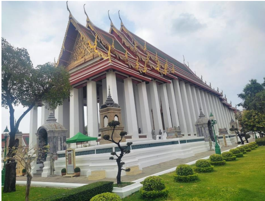
พระอุโบสถวัดสุทัศนเทพวราราม แสดงรูปแบบสถาปัตยกรรม ชุ่มประดู ชุ่มเสมา และรูปปั้นรอบพระอุโบสถ

ออกไปทางถนนอนุสาวรีย์ ด้านหลังหันไปทางถนนตรีทอง พระอุโบสถหลังนี้เป็นอาคารแบบเครื่องก่อ พระอุโบสถเริ่มสร้างในปี พ.ศ. ๒๓๗๗ แล้วเสร็จในปี พ.ศ. ๒๓๘๖ ในสมัยพระบาทสมเด็จพระนั่งเกล้าเจ้าอยู่หัว รัชกาลที่ ๓ มีรูปแบบสถาปัตยกรรมในยุคเดียวกับวิหารหลวง ความน่าสนใจของอาคารหลังนี้คือ มีขนาดกว้าง ๒๒.๖๐ เมตร ยาว ๗๒.๒๕ เมตร พระอุโบสถหลังนี้จึงมีความยาวที่สุดในประเทศไทย