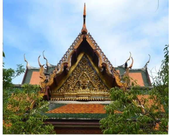
รูปแบบทางสถาปัตยกรรมของพระระเบียงคค และรายละเอียดส่วนหน้าบันของพระระเบียงคค