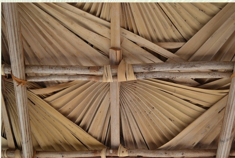
ภาพที่ 5 วัสดุก่อสร้าง(หลังคา)ใบลาน