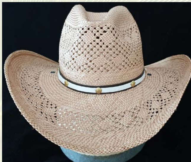
ภาพที่ 13 หมวกคาวบอยลายผูก