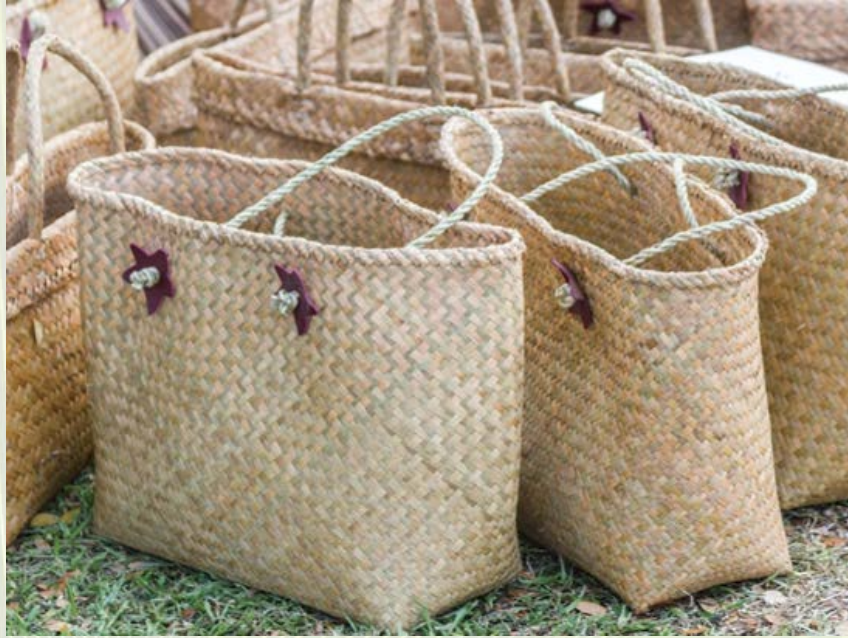
ภาพที่ 8 กระเป๋าใบลาน