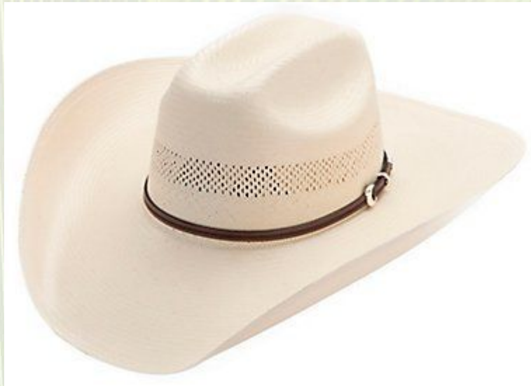
ภาพที่ 6 หมวกทรงควาบอย

เป็นระยะที่เกิดการรวมกลุ่มของคนในชุมชนเพื่อสร้างผลิตภัณฑ์สู่ตลาดที่กว้างขึ้น ซึ่งผลิตภัณฑ์จะมีรูปแบบที่เป็นไปตามสมัยนิยมและเป็นไปตามความต้องการของตลาด เช่น หมวกทรงควาบอย หมวกสตรีปีกกว้าง กระเป๋าถือสตรี กระเป๋าขนาดเล็ก(ใส่เหรียญ) กล่องใส่ทิชชู กล่องอเนกประสงค์ และ อื่นๆ