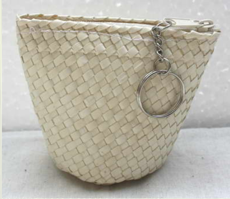
ภาพที่ 10 กระเป๋าขนาดเล็กใส่เหรียญ