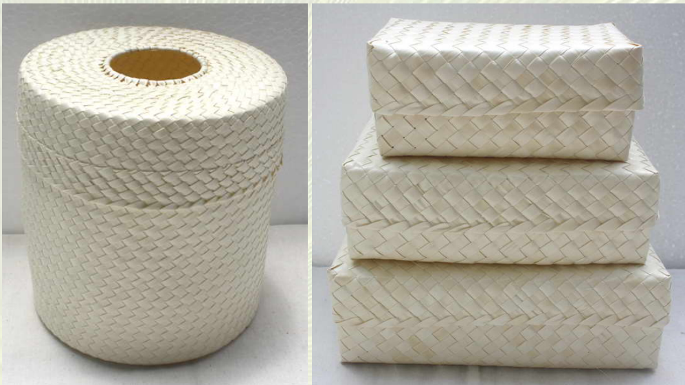
ภาพที่ 11 กล่องใส่ทิชชูและกล่องอเนกประสงค์