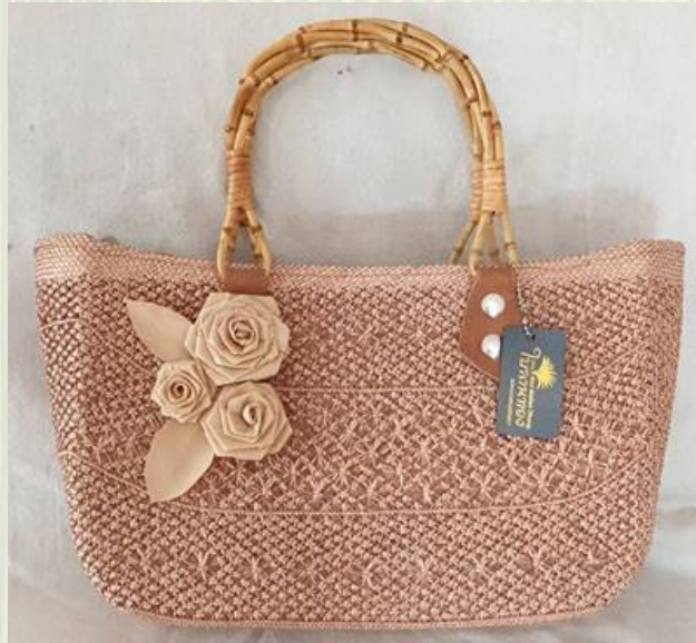
ภาพที่ 12 กระเป๋าสตรีลายผูกนิลวรรณ

เป็นระยะที่มีการเปลี่ยนแปลงทั้งด้านรูปแบบผลิตภัณฑ์และวิธีการขึ้นรูปมากที่สุด โดยกลุ่มผู้ผลิตได้รับการสนับสนุนความรู้และพัฒนาทักษะใหม่ๆจากการส่งเสริมของภาครัฐและหน่วยงานภายนอก ประกอบกับความก้าวหน้าทางด้านเทคโนโลยีทำให้ผู้ผลิตเกิดการเรียนรู้ได้กว้างมากขึ้นซึ่งส่งผลต่อการพัฒนาและต่อยอดผลิตภัณฑ์ รูปแบบและวิธีการที่มีการยกระดับอย่างชัดเจน เช่น วิธีการขึ้นรูปซึ่งจากเดิมใช้วิธีการสาน พัฒนามาเป็นการผูกลาย การย้อมสีโบลาน การพัฒนาเทคนิคเฉพาะซึ่งทำให้รูปแบบผลิตภัณฑ์มีความแตกต่างจากรูปแบบเดิม มีการนำวัสดุอื่น ๆ มาใช้ผสมผสาน ซึ่งทำให้ผลิตภัณฑ์เกิดมูลค่าเพิ่มมากขึ้น