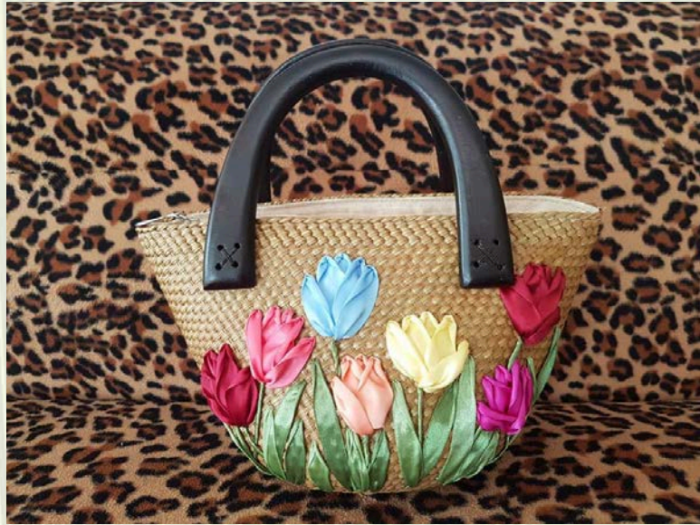
ภาพที่ 22 กระเป๋าใบลานวัสดุและเทคนิคผสมผสาน