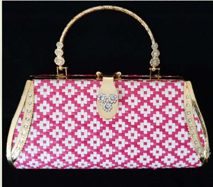
ภาพที่ 16 กระเป๋าถือสตรีใบลานย้อมสีลวดลายसान