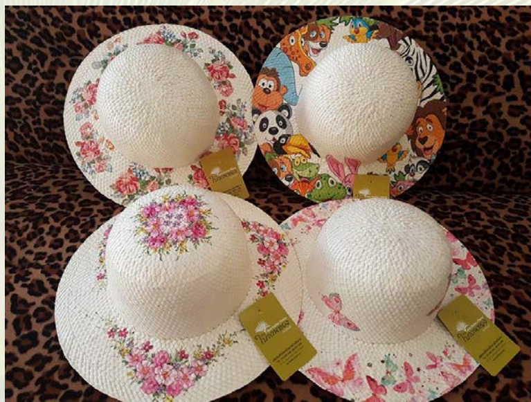
ภาพที่ 19 หมวกโบลานตกแต่งลวดลายเทคนิค เดคูพาจ (Decoupage)