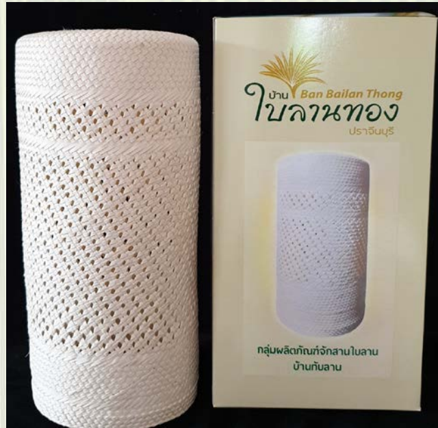
ภาพที่ 14 โคมไฟใบลาน