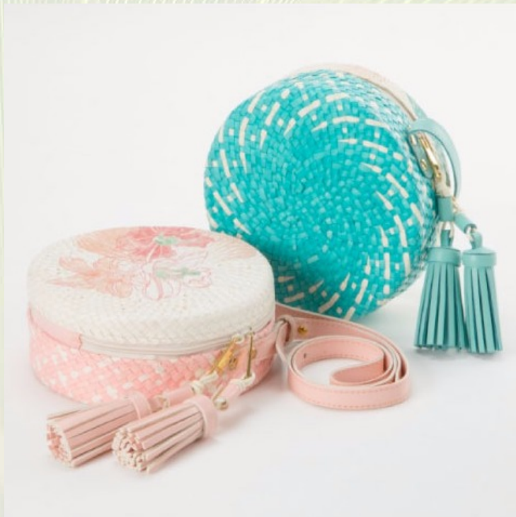
ภาพที่ 17 กระเป๋าสะพายสตรีใบลานย้อมสีลวดลายसान