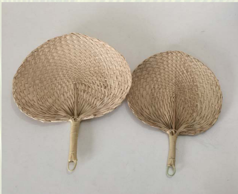
ภาพที่ 4 พัดใบลาน