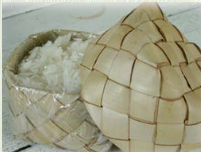
ภาพที่ 3 ก่องข้าวไบอลาน ที่มา: takraibaiphai, นามแฝง (ม.ป.ป.)