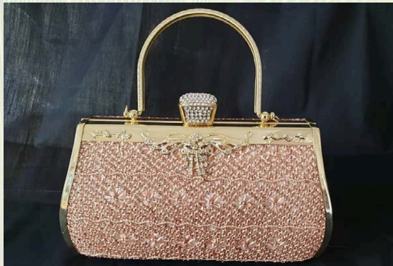
ภาพที่ 21 กระเป๋าใบลานวัสดุและเทคนิคผสมผสาน