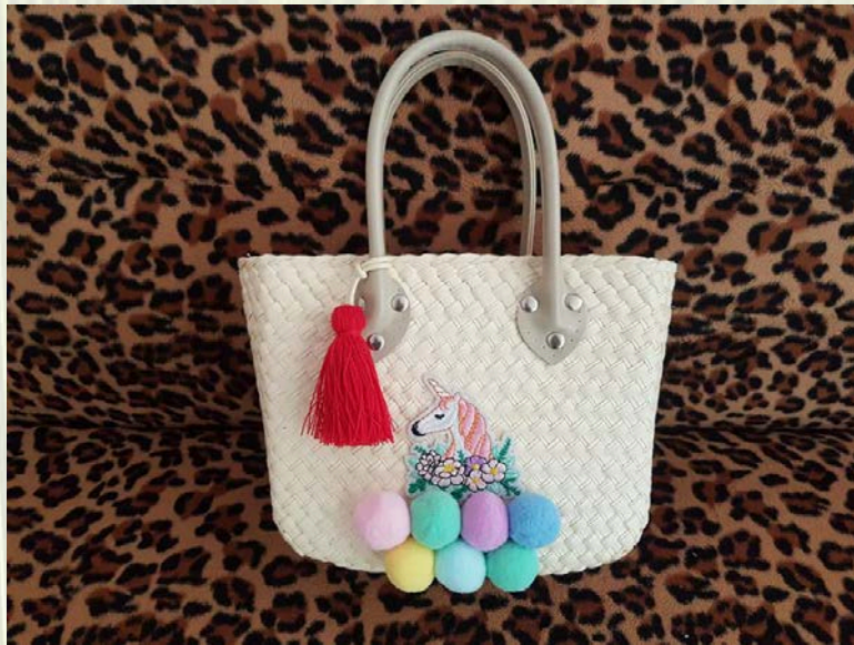
ภาพที่ 20 กระเป๋าใบลานวัสดุและเทคนิคผสมผสาน