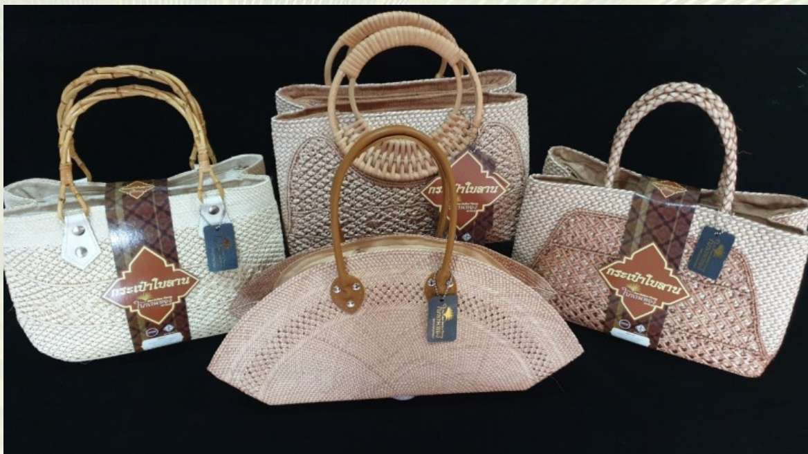
ภาพที่ 15 รูปแบบกระเป๋าสตรีลายผสมผสาน