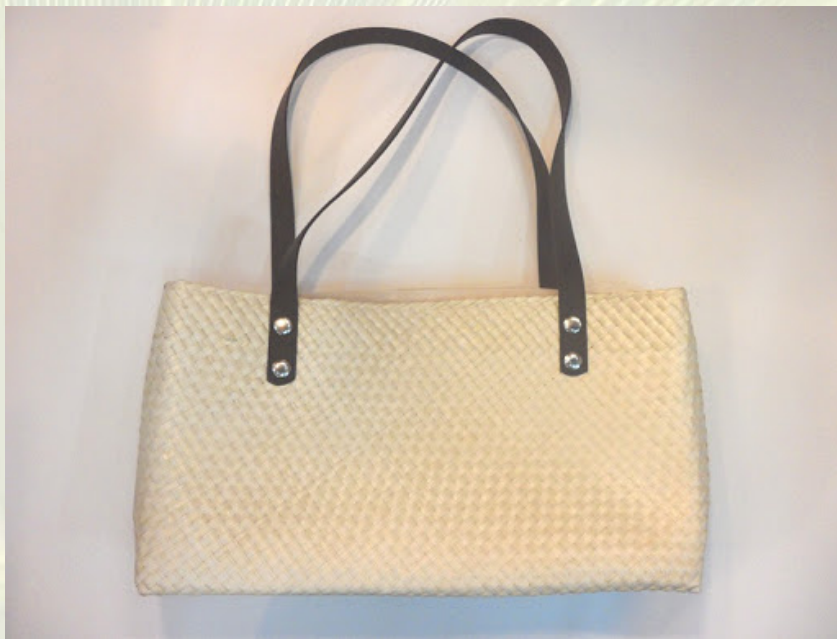
ภาพที่ 9 กระเป๋าถือสตรี