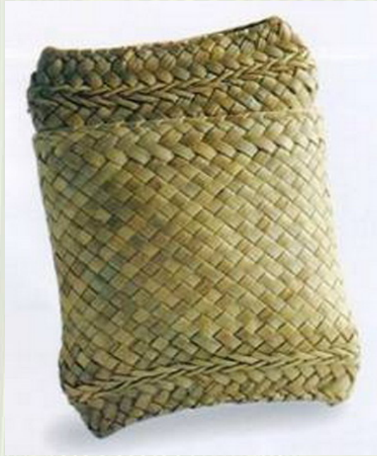
ภาพที่ 2 สุ่มก (หมวก) หรือ กระเป๋าใส่ของที่ทำจากไบอลาน