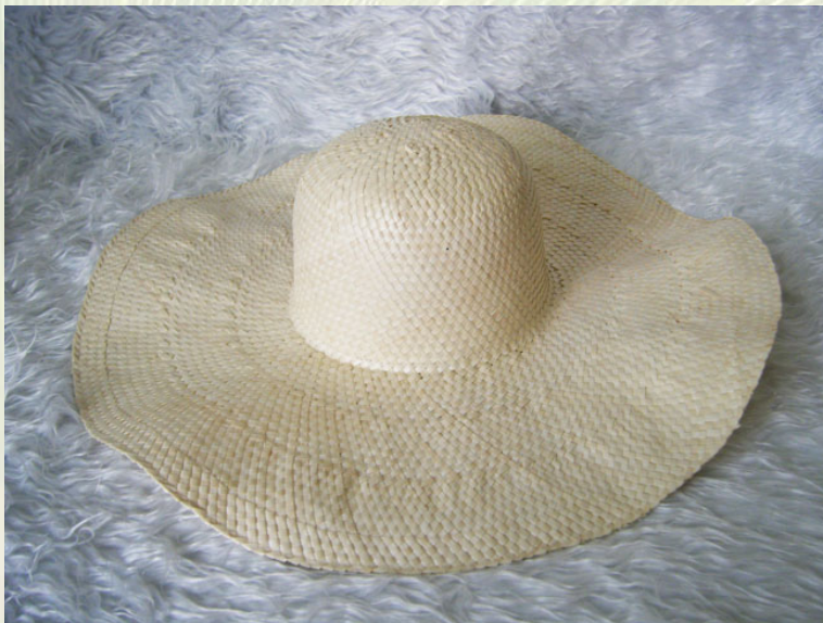
ภาพที่ 7 หมวกสตรีปีกกว้าง