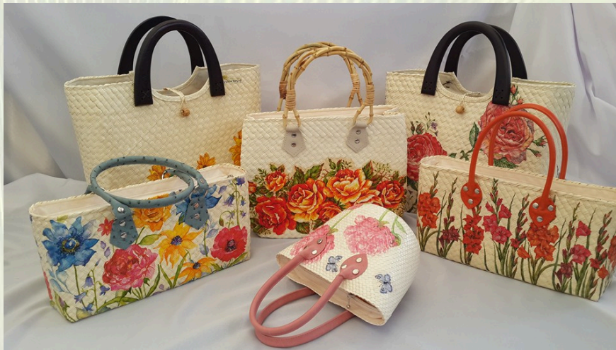
ภาพที่ 18 กระเป๋าโบลานตกแต่งลวดลายเทคนิค เดคูพาจ (Decoupage)

เป็นระยะที่ผลิตภัณฑ์มีการผสมผสานทั้งด้านเทคนิควิธีการและรูปแบบเพื่อให้เกิดรูปแบบผลิตภัณฑ์ที่มีพัฒนาองรับกับความต้องการของตลาดในปัจจุบัน รูปทรงและลวดลายมีความเรียบง่ายมากขึ้น แต่จะเน้นการประดับตกแต่ง ตัวอย่างเช่นใช้วิธีการตกแต่งที่เรียกว่า เดคูพาจ (Decoupage) สร้างลวดลายการปัก และใช้วัสดุตกแต่ง อาทิเช่น พลาสติก หนังเทียม อัญมณีเทียม และอื่นๆ เพื่อนำมาผสมผสานให้ผลิตภัณฑ์มีความหลากหลายมากขึ้น