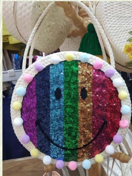
ภาพที่ 23 กระเป๋าใบลานวัสดุและเทคนิคผสมผสาน

ขอขอบพระคุณ กลุ่มจักสานใบลาน บ้านทับลาน จังหวัดปราจีนบุรี ผู้จัดทำ ฝ่ายกิจการนักศึกษา คณะสถาปัตยกรรมศาสตร์และการออกแบบ มทร.พระนคร จัดทำข้อมูล วันที่ 21 เมษายน 2563