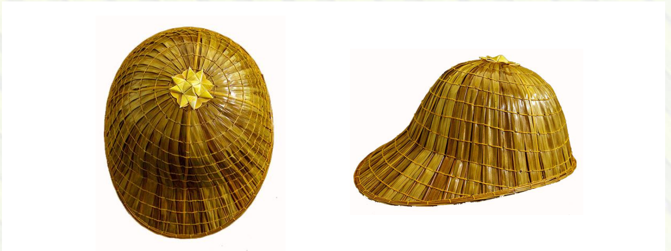
ภาพ : หมวกทรงกะโหลกบ้านน้ำเชี่ยว

ทรงกะโหลก เป็นหมวกที่มีขนาดเล็กที่สุดใน ๕ รูปแบบ มีปีกหมวกยื่นเฉพาะด้านหน้า มีลักษณะคล้ายหมวกภาคสนามของทหาร รูปทรงไม่มีปีกด้านข้างและด้านหลังที่ด้านลม จึงเหมาะกับการใช้ใส่ขับเรือ หรือนั่งเรือออกทะเล หรือแม่น้ำ ซึ่งยังสามารถใช้ในการวิดน้ำเรือเมื่อน้ำเข้ามาในเรือได้