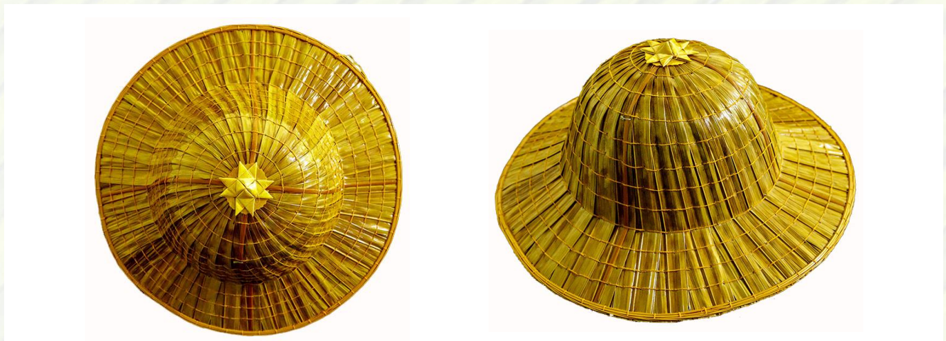
ภาพ : หมวกทรงสมเด็จบ้านน้ำเชี่ยว

ทรงสมเด็จ มีลักษณะเป็นหมวกทรงกลม ส่วนกลางเป็นรูปทรงครึ่งวงกลมซึ่งไว้สวมศีรษะและมีปีกหมวกโดยรอบ แต่เดิมเรียกว่า ทรงนเรศวร แต่ในปัจจุบันเรียกว่า ทรงสมเด็จ โดยมีประวัติว่า เมื่อครั้งสมเด็จพระศรีนครินทราบรมราชชนนี และสมเด็จพระพี่นางเธอเจ้าฟ้ากัลยาณิวัฒนา กรมหลวงนราธิวาสราชนครินทร์ ทรงนำหน่วยแพทย์เคลื่อนที่ พอสว. มาเยี่ยมราษฎรที่จังหวัดตราด ณ โรงเรียนบ้านเนินดินแดง อำเภอแหลมงอบ ในวันที่ ๒๔ พฤศจิกายน พ.ศ. ๒๕๒๔ กลุ่มแม่บ้านเกษตรกรบ้านน้ำเชี่ยว ได้นำหมวกใบจากที่ได้ออกแบบทรงนี้ ขึ้นทูลเกล้าฯถวาย และได้พระราชทานชื่อหมวกใบจากรูปทรงนี้ว่า ทรงสมเด็จ (มิวเซียมไทยแลนด์, ๒๕๕๙)