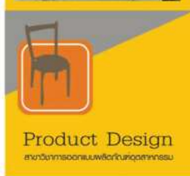
Product Design สาขาวิชาการออกแบบเฟอร์นิเจอร์อุตสาหกรรม นายกวินท์ อิศระวาณิชย์